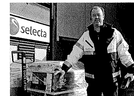
Efter lossningen på Selecta är det dags att börja dagens lastningsrunda.