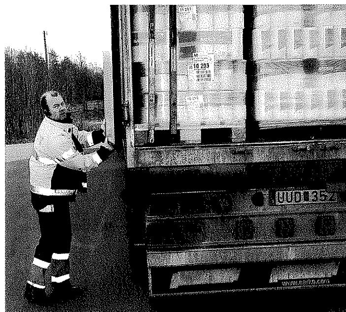
48 pall till Jönköping är snart på väg.