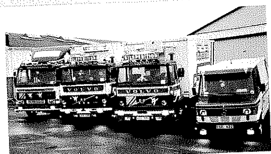
Åkeriets vagnpark 1989.