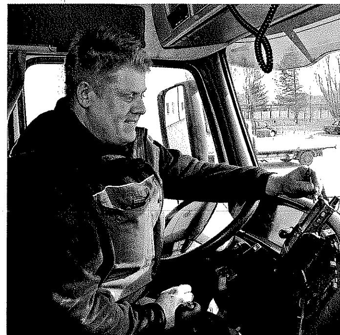
Alla bilar har handdatorer där förarna registrerar vad som händer med godset.